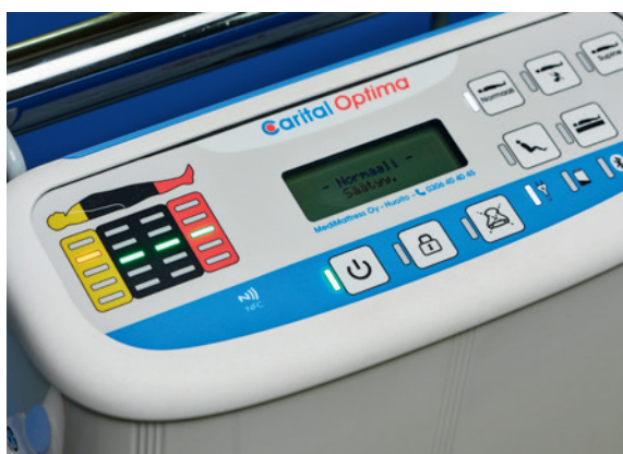
Pumpen er fuldautomatisk og nem at betjene.